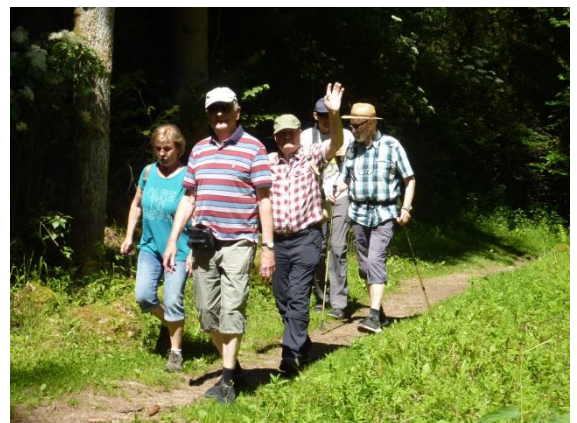
Ein Teil der Wandergruppe kurz vor dem Anstieg nach Leidingshof