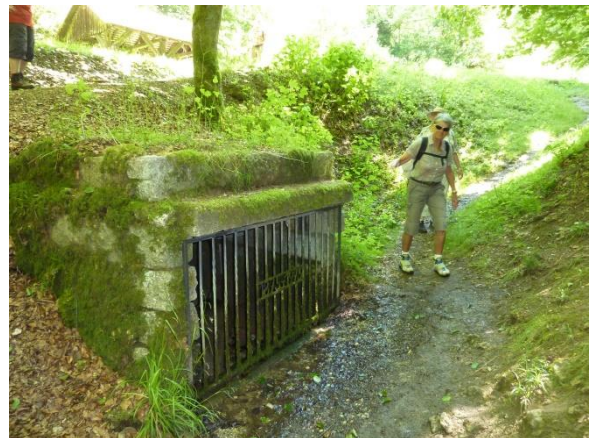
Widder, die hydraulische Wasserpumpe

Am Kriegerdenkmal haben wir den älteren Mann getroffen der sich schon seit vielen Jahrzehnten um die Pflege des Kriegerdenkmals kümmert.