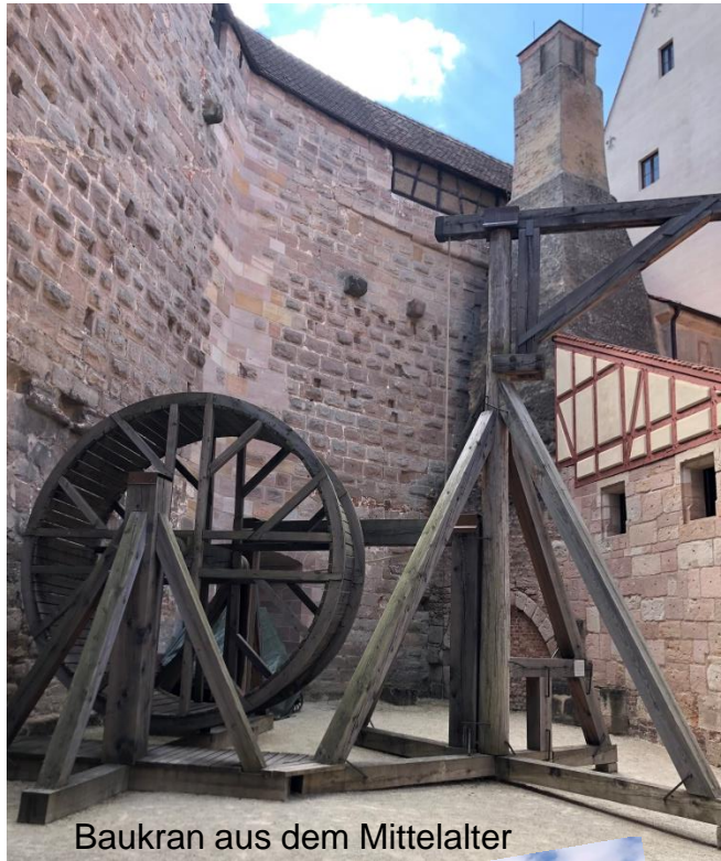
Baukran aus dem Mittelalter

So kommt es, dass im späten Mittelalter eine ganze Weile lang Berlin von Cadolzburg und Ansbach aus regiert wurde. Die Burg wurde 2 Wochen vor dem Ende des 2. Weltkrieges im April 1945 in Brand geschossen. Der Brand konnte nicht gelöscht werden. Es brannte eine ganze Woche.