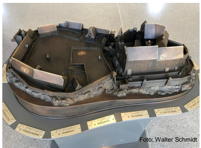
Ein Modell wie die Burg früher wohl ausgesehen hat