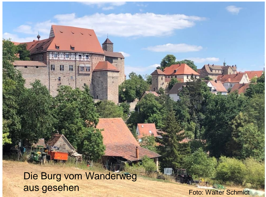
Die Burg vom Wanderweg aus gesehen