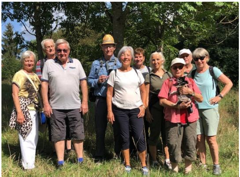
Die Wanderer*innen bei bester Laune

Vom „Neuen Friedhof“ in Feucht in den Wald. Unter der A9 durch, entlang des Gauchsgraben zum Jägersee und weiter entlang einiger Weiher bis zum „Alten Kanal“. Am Kanal in den Wald zum GH Brunner in Röthenbach St. Wolg. ME bei schönem Wetter im Biergarten. Alle Wanderer und drei Naturfreunde die zum Essen kamen, waren vollauf zufrieden. Den Rückweg in geänderter Wegführung zum „Neuen Friedhof“ in Feucht.